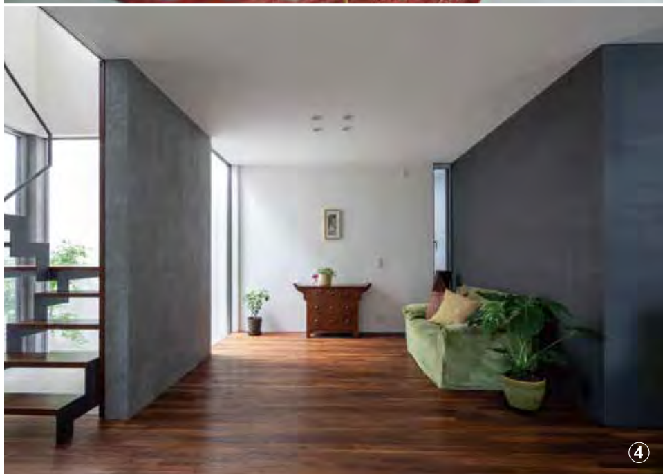
① 設計:藤田征樹 / ②③ 設計:河内真菜 / ④ 設計:竹内美穂・加藤純