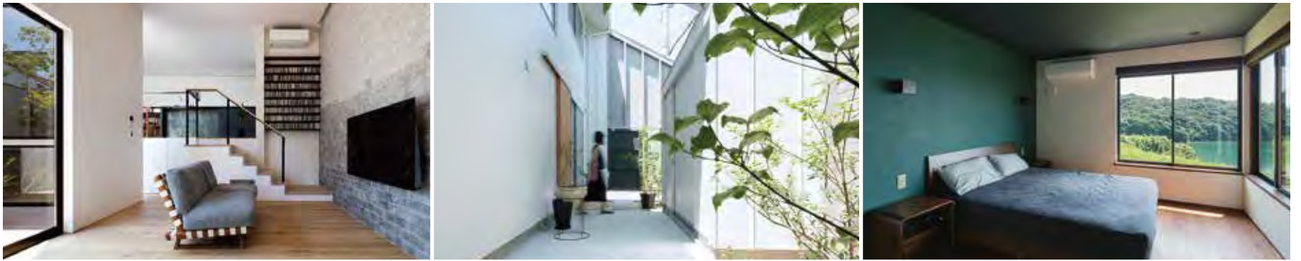
使用写真(左から) 設計:山田直真/設計:原浩二/設計:山澤宣勝